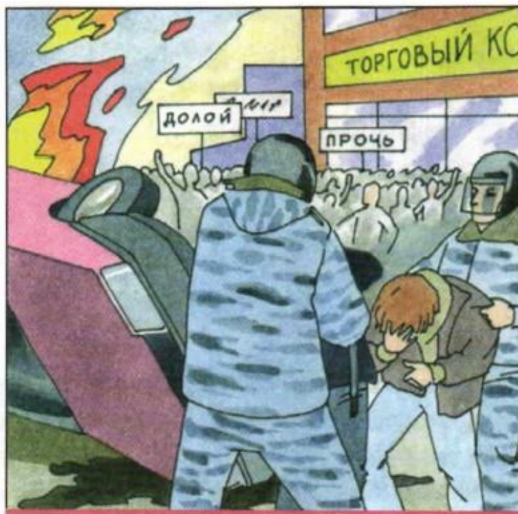
Демонстрация, которая переросла в хулиганские действия и беспорядки

Экстремизм – это приверженность отдельных людей или групп к крайним взглядам и поступкам, которые подспудно или непосредственно направлены против законных политических прав и свобод граждан, являются угрозой для гражданского мира, национального согласия и духовной, религиозной терпимости в обществе и государстве. Экстремистские взгляды и действия – это прямой путь к нарушению закона.